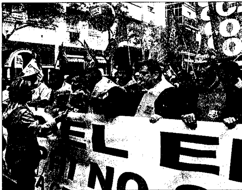
Imagen de la última huelga general llevada a cabo en toda la Bahía de Cádiz, con motivo del cierre de Delphi.